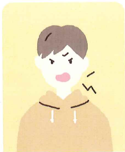
怒りやすくなった